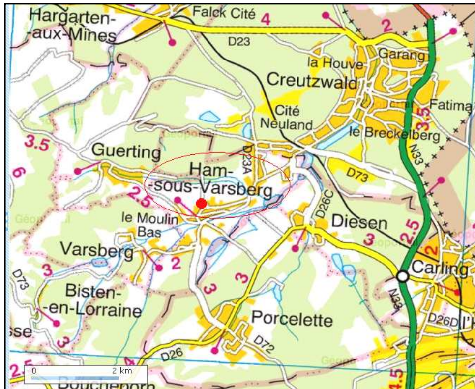
Figure 1 : Localisation de la commune de Ham-sous-Varsberg

La commune de Ham-sous-Varsberg se situe dans le département de Moselle, à la frontière allemande, à environ 1 km au sud ouest de Creutzwald et à 14 km au nord ouest de Saint-Avold.